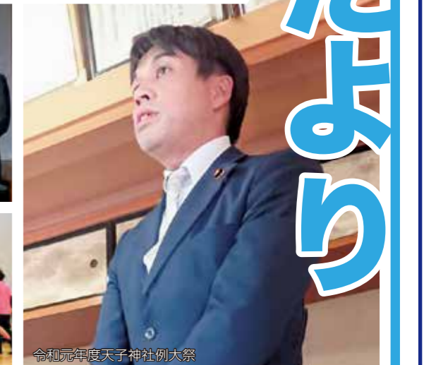
令和元年度天子神社例大祭