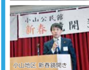
小山地区 新春鏡開き